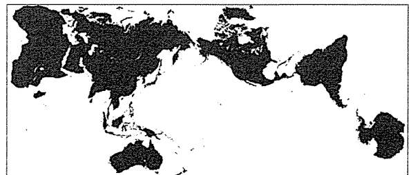
オーサグラフ世界地図